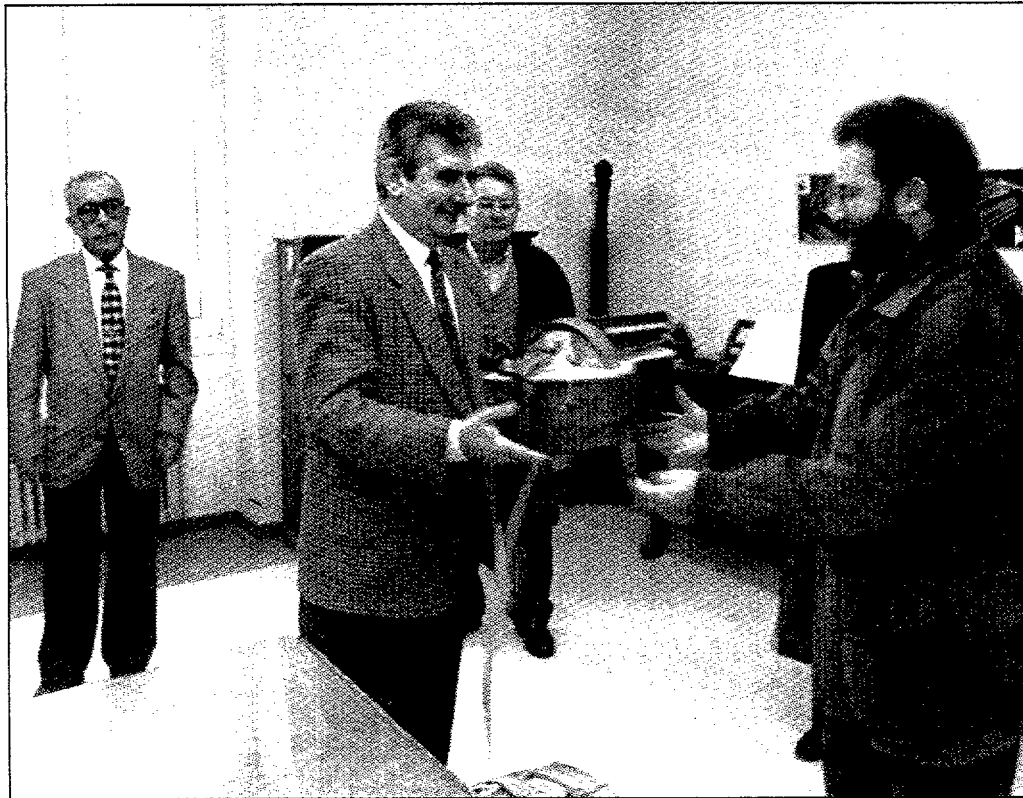
Una de las zanfonas la recogió el grupo Xistra, de la ciudad del Landro