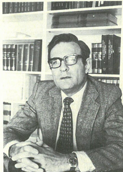
“Olvidamos muchas veces lo que representa la privación total de libertad.”