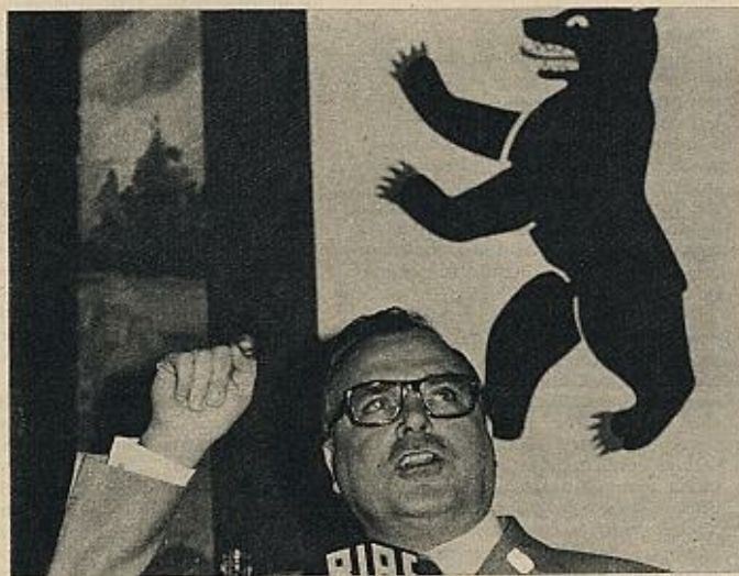
Kohl: un liberal más bien ambiguo.

litar. Parece fascinado por la figura de Caramanlis; se reprocha a este hombre de pensamiento propio, intelectual, por ahogar sus propias ideas para seguir las de su jefe político, al que se atribuye una capacidad práctica pero no ideológica en la política. Ello hace pensar que el presidente de la República no sería más que un instrumento en manos del jefe de gobierno, y que incluso si un día Caramanlis encontrara más seguridad y más permanencia para su poder en la presidencia, Tsatsos no vacilaría en ofrecerle su cargo. Aparte de este reproche, la figura del nuevo presidente, en tanto que pensador y que hombre de moral y honestidad comprobadas, y de una gran historia de dignidad cívica bajo la dictadura es comúnmente aceptada por todos en Grecia. ■