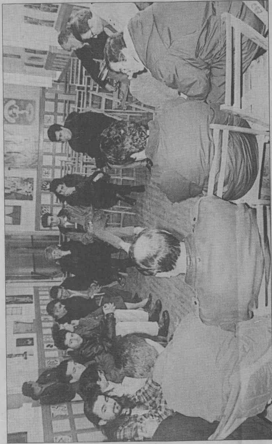
Algunos de los asistentes a los cursos del Cuartel Viriato

El próximo día 12 de junio se cumplen dos años desde que un grupo de profesores y alumnos zamoranos entrasen en el antiguo Cuartel Viriato y constituyesen la Escuela de Sabiduría Popular, con sede entre los viejos muros de uno de los pabellones de la edificación castrense. Desde entonces, la entidad ha desarrollado un intenso programa de actividades formativas y cursos, con la presencia de prestigiosos personajes que se han desplazado a Zamora de forma totalmente desinteresada, atraídos por el atractivo de tan singular universidad, no oficial y totalmente gratuita, sin matrículas ni evaluaciones. Los alumnos han realizado un balance «totalmente positivo», a la vez que lamentan que no hayan sido más los zamoranos que se hayan beneficiado de los cursos en este tiempo. Y es que, ya se sabe por el dicho, «en casa del herrero, cuchillo de palo».