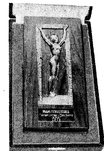
El trofeo de «Los Populares», brillantemente conseguido por la frase publicitaria «Trasplántese a Espléndido».

Es el caso que, siempre por laudables motivos, la firma «Garvey», es motivo de interés periodístico. «Garvey», progresa en las dos bases esenciales de desarrollo: industrialización y comercialización. Incrementa, sistemáticamente, sus pagos, sus viñedos, sus cultivos, en esa impresionante geografía gaditana que arullan y templan los vientos y brisas de la bahía. Moderniza sus bodegas y crea las mejores instalaciones jerezanas, con un concepto nue-