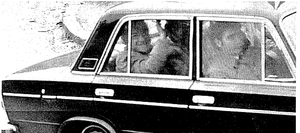
1976. El 30 de diciembre el secretario general del PCE salía de la cárcel de Carabanchel

superara hechos como los acaecidos, pues si se repetían no era probable que a él le dejaran las manos libres para sofocarlos. Les instó además a exigir responsabilidades con la máxima energía a los jefes comprometidos en la intona golpista, pero sugiriendo que la represión tuviera un alcance limitado para que el problema no acabara siendo mayor. Suárez, que nunca había confiado en el general Armada, manifestó que se equivocó en la opinión que tenía de él pues pensaba que había permanecido leal, pero el Rey le aclaró que no, que era el jefe de la conjura. Don Juan Carlos refirió en este encuentro sus llamadas a los capitanes generales. Carrillo cuenta que el Rey les explicó cómo Milans del Bosch se hizo el remolón a las órdenes del Rey, pensando que debía ganar tiempo para ver si otras guarniciones se sumaban al golpe o cómo el capitán general de Sevilla se había acostado temprano bajo los efectos del alcohol consumido en gran cantidad; el Rey pidió que no le despertaran. Ejemplar fue la actitud del capitán general de Madrid, Guillermo Quintana Lacaci, que impidió la sublevación de la Brunete y cuyo hijo es hoy jefe de seguridad de la Casa Real. Quintana Lacaci fue asesinado más tarde por ETA. "El Rey nos contó que, hablando con un coronel jefe de un regimiento, éste le había contestado: 'Cumpliré sus órdenes, señor, pero ¡qué ocasión estamos perdiendo!'".