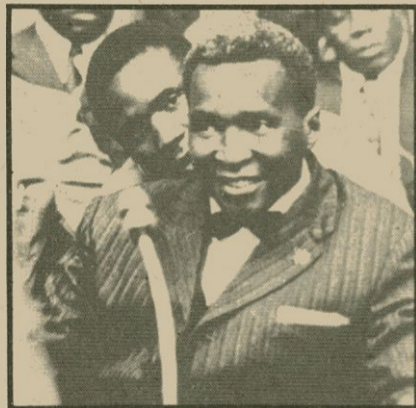
El derrocat dictador, president Francisco Macías Nguema

D'altra banda, el ministre d'Afers Estrangers, Marcelino Oreja, que està viatjant amb Adolfo Suárez pel Brasil, oferí una conferència de premsa en la qual manifestà que el govern espanyol ofereix des d'ara una àmplia ajuda al poble guineà.