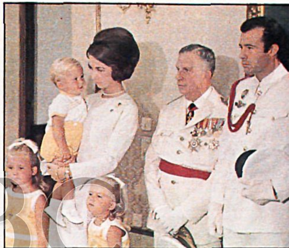
La posibilidad de que Alfonso de Borbón fuera nombrado sucesor llegó tarde. Su boda con una nieta de Franco fue posterior al nombramiento de su primo Juan Carlos de Borbón.

Durante la estancia de Don Juan en Madrid ocurrieron mu-