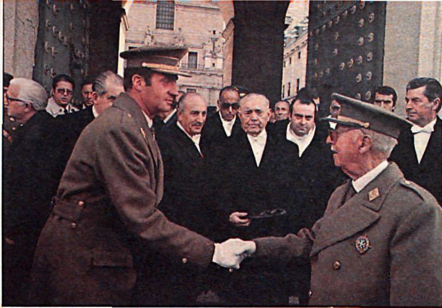
Franco era favorable a la Monarquía, debido a la protección de Alfonso XIII.