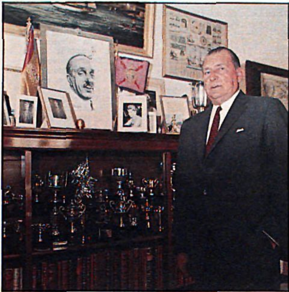
Algunas entrevistas de Don Juan pusieron nervioso a Franco.