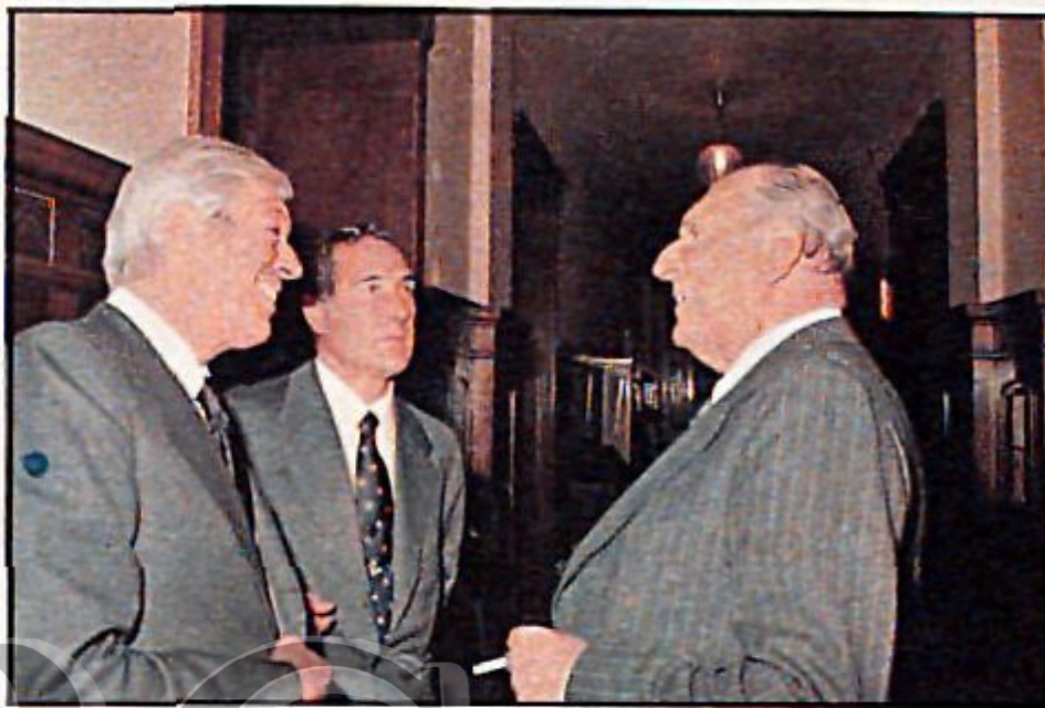
Don Juan, conversando con Guillermo Luca de Tena, actual director de «ABC».

Finalmente, el 28 de septiembre fue suspendido El Alcázar , que podríamos llamar liberal, editado por hombres vinculados al Opus y a la causa monárquica. Pocos días después reaparecía editado por la Hermandad de Nuestra Señora Santa María del Alcázar de Toledo, en la línea que más o menos tiene hoy.