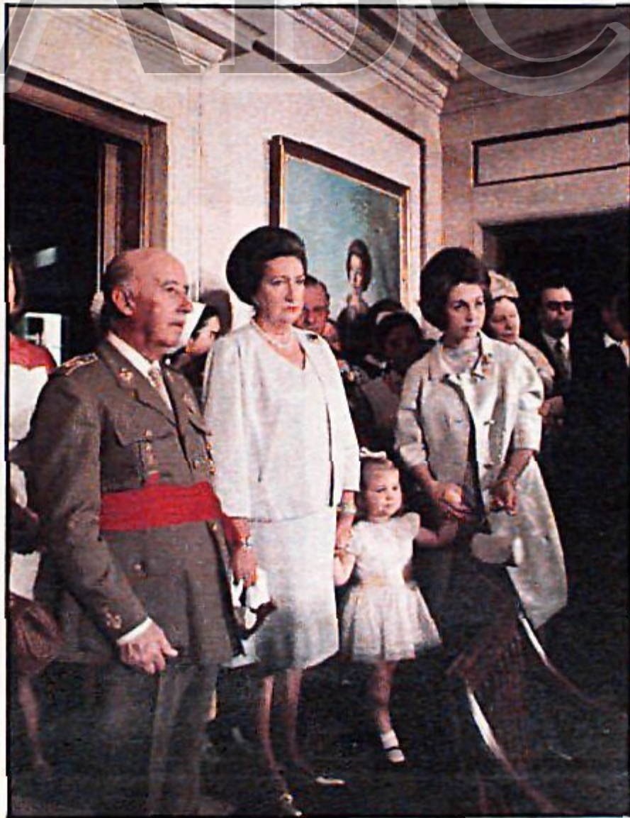
El punto de arranque de la ofensiva juanista fue el bautizo del Príncipe Felipe, el 8 de febrero de 1968.

Alfonso XIII, que convirtió los ascensos por méritos de guerra durante el largo y penoso conflicto marroquí en un instrumento de favoritismos y compensaciones a lealtades personales que, aparte de los méritos y capacidad personales, aprovecharon extraordinariamente a Franco. Este, pues, no podía por menos que sentirse agradecido con la institución monárquica, aunque la gratitud no suele ser la principal virtud de los poderosos.