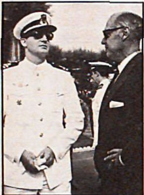
Laureano López Rodó despejó el panorama a favor del Príncipe.