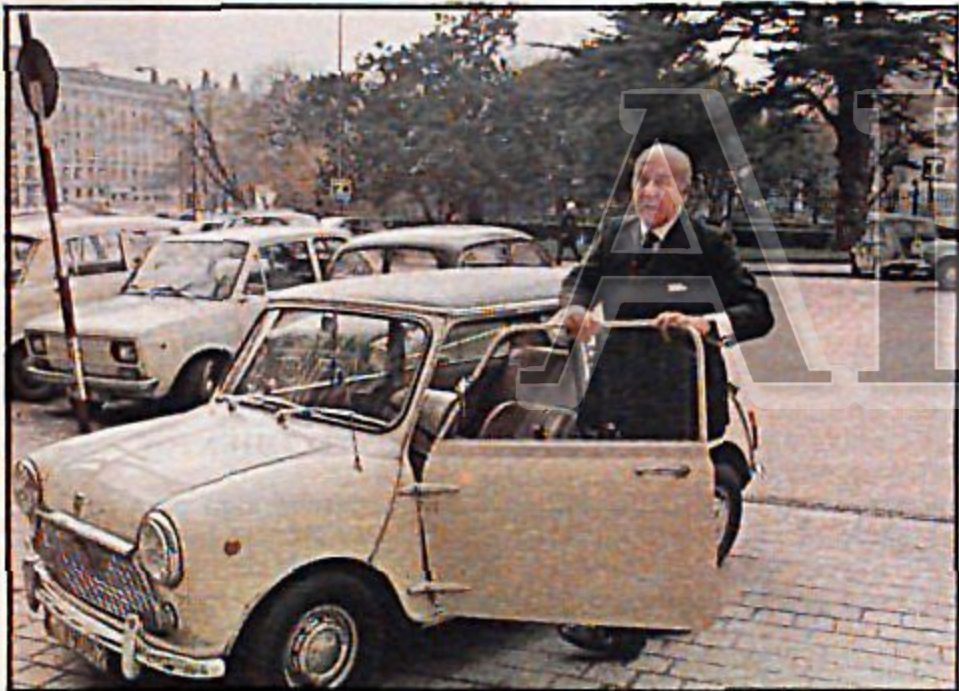
Areilza era jefe del secretariado político de Don Juan.

Sindical de Trabajadores, filial de las citadas Vanguardias Jesuítas y antecedente de la actual Organización Revolucionaria de Trabajadores, de carácter maofista.