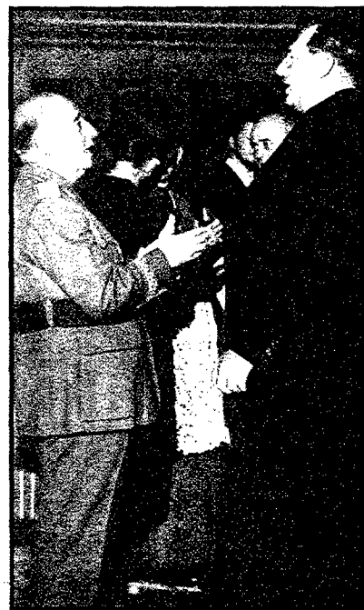
Francisco Franco y el Conde de Barcelona, en el bautizo de la Infanta Elena.

En realidad, los únicos que tenían medios abundantes para seguir adelante eran los co-