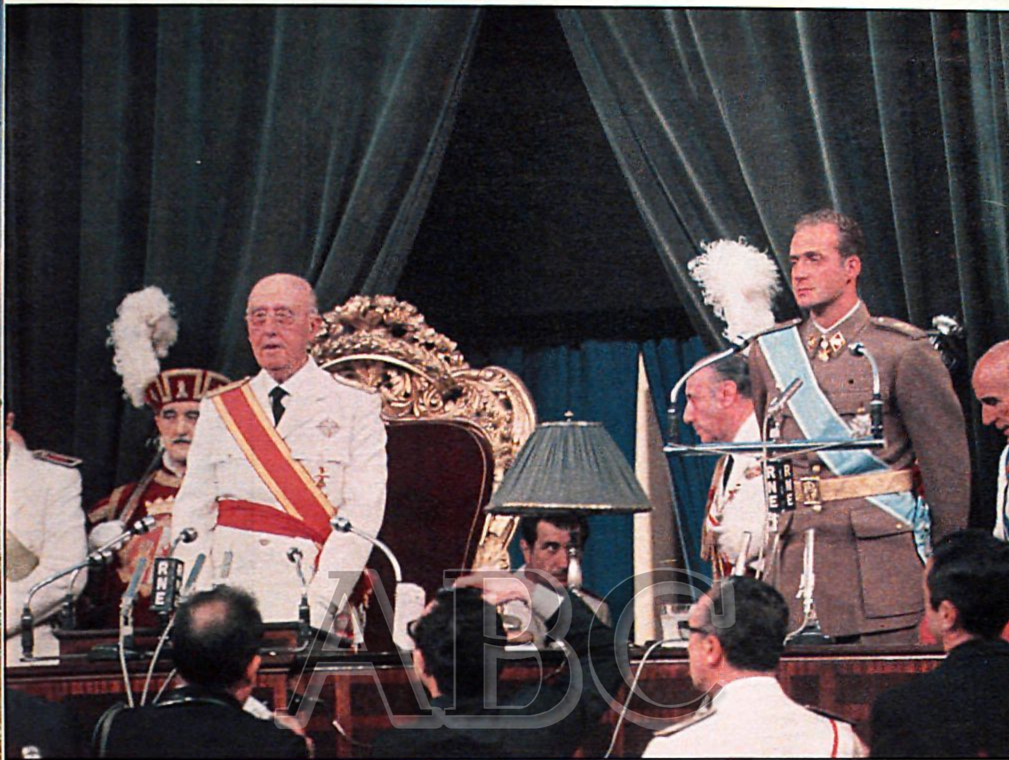
A propuesta de Franco, las Cortes aprobaron el nombramiento de Don Juan Carlos como sucesor en la jefatura del Estado.

rárquico y ordenancista, propio de un militar como él.