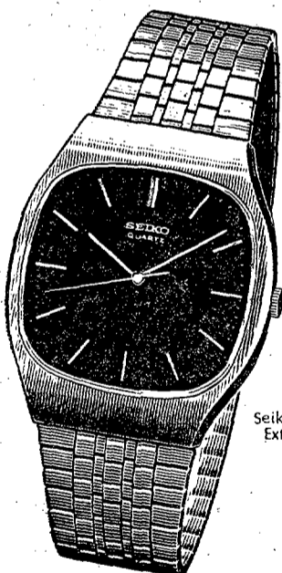
Seiko Quartz Extraplano