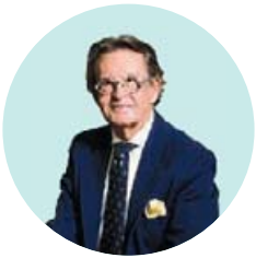
Por Josemi Rodríguez-Sieiro