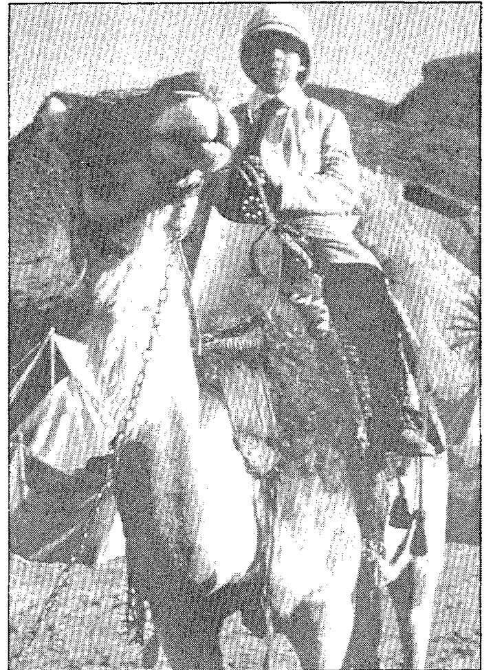
«El joven Indiana Jones» está producida por George Lucas