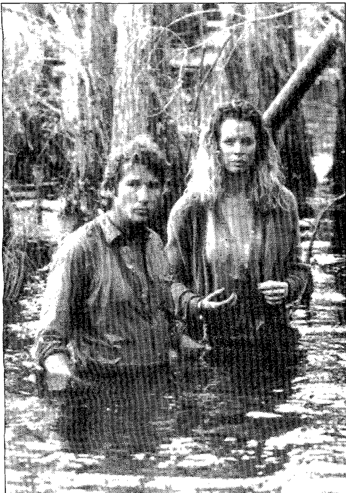
La Basinger no daría un mal presidente de parlamento

Y ahora, los ídolos del crecepelelo. A Julio Salinas le ponen una vela un domingo sí y otro también en Can Barça para que resuelva la papeleta en la media hora de rigor que Cruyff lo saca, a saludar a las visitas. Es un santo fajador, rentabilizador de las torpezas propias y ajenas, imán en la bota. Nos dice Salinas que desde que usa el tónico capilar con nombre de premier sueco remata mejor de cabeza. (Que se lo cuenten a Dertycia). Lo de Martín Vázquez es otra cosa. Viendo como le silbaban hace diez días en el Bernabeu, y a la espera de las banderillas que uno confía que le plante el miércoles a Paco Buyo en Turín (pintan bastos), no es tan seguro que el cerebro ex-madridista sea un ídolo comercial rentable por estos pagos, en los que, hay que invertir la carga de la prueba, todo el mundo es madridista y conspirador mientras no se demuestre lo contrario.