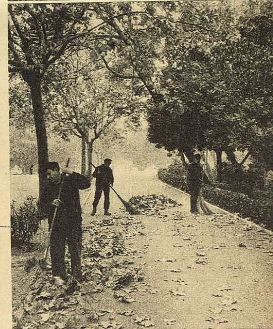
Los primeros fríos del otoño, que alcanzan ya niveles invernales, han coincidido con la poda revitalizadora de los árboles de nuestras calles. Todo un ejército de podadores se ha extendido por la ciudad, para completar la imagen otoñal que ya de por sí ofrecen los servicios de limpieza de las hojas caídas en los parques públicos de nuestra ciudad.