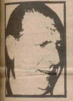
(Crónica de Madrid en página 5)

(A la titularidad de los derechos de sucesión)