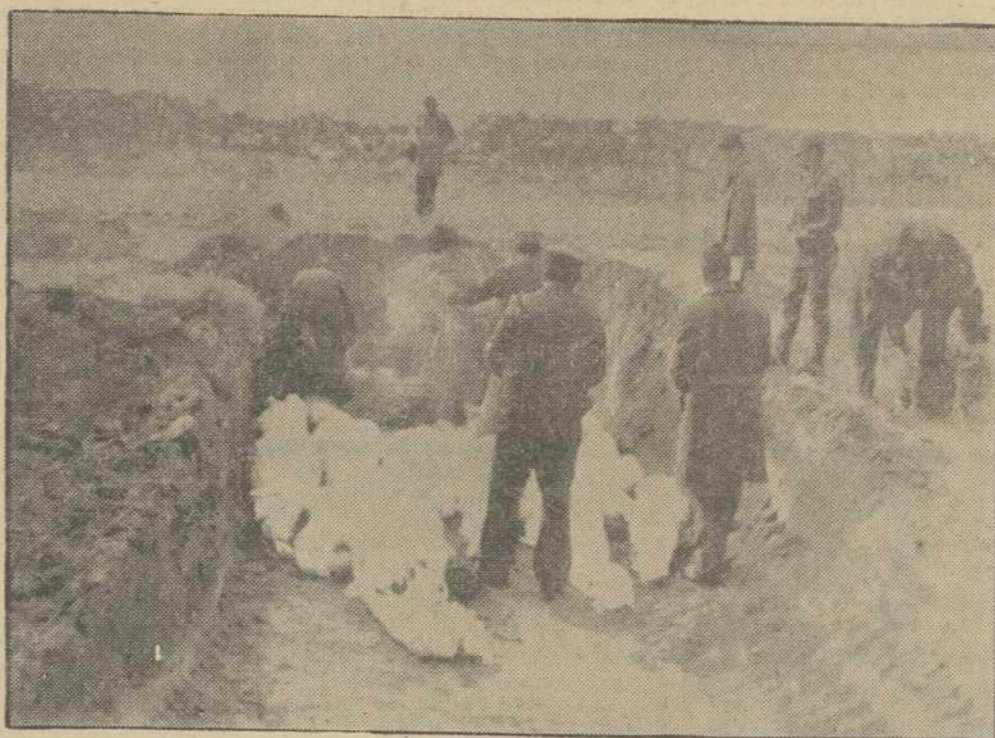
Tropas del Ejército turco y grupos de voluntarios proceden al entierro de las víctimas del reciente terremoto que asoló la zona oriental del país. Los cuerpos, envueltos en lienzos blancos sobre los que se extienden ramas y hierba seca, aparecen alineados en el fondo de una fosa común abierta con una paletadora. — (Foto CIFRA GRAFICA)