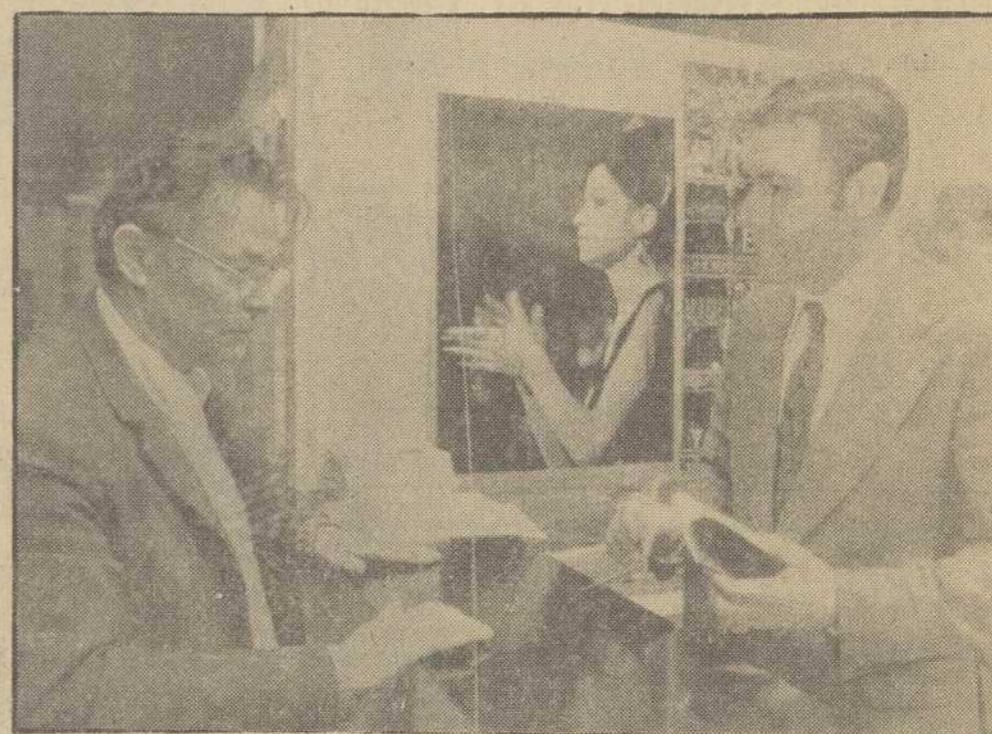
En la presente fotografía aparece un miembro del Consulado español en París, comprobando la documentación de un compatriota que acude a recoger la correspondiente papeleta para participar en el referéndum nacional que se celebrará el próximo día 15, sobre la Ley de Reforma Política que recientemente fue aprobada por las Cortes.