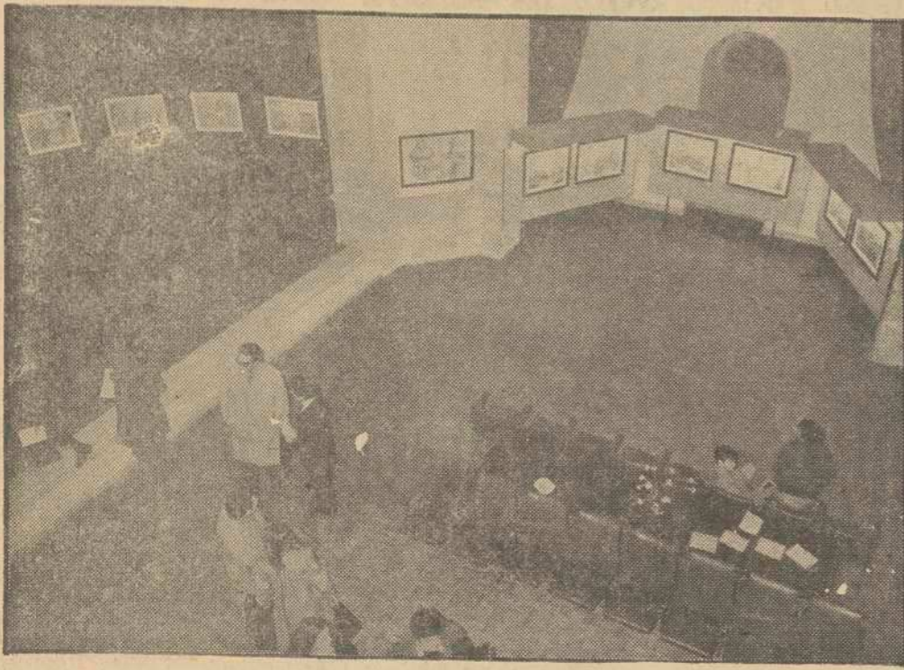
EXPOSICION DE PACIOS