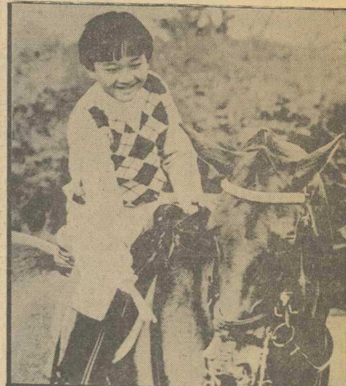
El príncipe Aya del Japón, hijo del príncipe heredero Akihito y la princesa Michiko, acaba de cumplir los once años. En la presente fotografía obtenida en los jardines del palacio imperial de Tokio, el pequeño príncipe aparece montando su caballo "Seishungo" con el que realizó unas exhibiciones ante sus abuelos los emperadores.