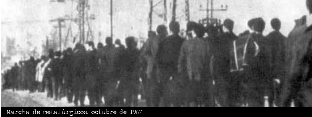
Marcha de metalúrgicos, octubre de 1967

Tras la creación de la Comisión del Metal, se habían incrementado el número de huelgas en las empresas tanto del Metal como de otros sectores y, en los años siguientes, aún se extenderían con más fuerza en la región y se complementarían con acciones callejeras de protesta. Según informes del Ministerio de Trabajo, entre 1963 y 1967, hubo 155 conflictos en Madrid, de los que 75 tuvieron lugar en 1967. También las demandas laborales presentadas en las Magistraturas del Trabajo de Madrid pasaron de 7.000 en 1964 a 14.600 en 1967.