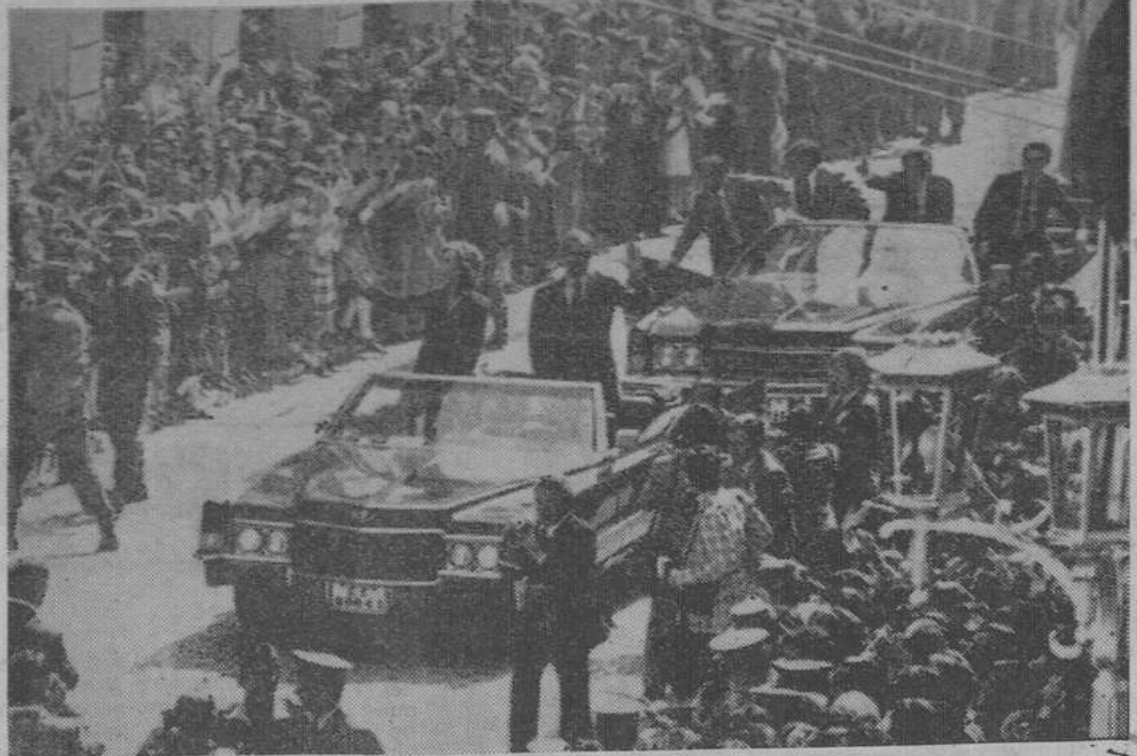
HUELVA, 31. — Los Reyes de España, don Juan Carlos y doña Sofía, saludan al público congregado frente al Ayuntamiento.

A su llegada a Huelva, el entusiasmo de los onubenses se desbordó en la plaza del Ayuntamiento. Desde la entrada a Huelva hasta la plaza donde se halla el edificio consistorial (unos dos kilómetros), el gentío se aglomeraba en las aceras aplaudiendo el paso de los Reyes. Sus Majestades, que llegaron en coche descubierta, recibieron el saludo del alcalde de la ciudad y la señora del acade obsequio a la Reina con un ramo de flores. Los Reyes subieron a un pódium para escuchar el Himno Nacional y a continuación el Rey don Juan Carlos, acompañado del capitán general de la II región, pasó revista a la compañía de honores del regimiento de Infantería Granada número 34,