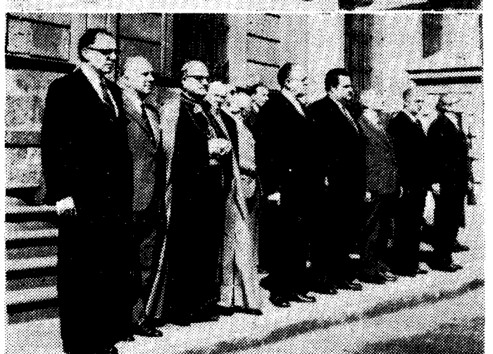
El teniente general Pérez de Lema, durante su discurso en Capitanía General, en el acto de toma de posesión. Abrazando al gobernador civil de Las Palmas. Con el capitán general accidental y, finalmente, las autoridades civiles y eclesiásticas, presenciando el desfile de las fuerzas. (Fotos RAMOS — PAG. 24)