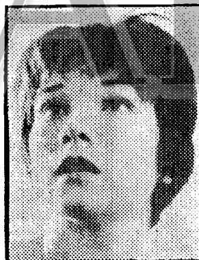
Shirley Mac Laine, la protagonista de «La calumnia».

2.15. Carta de ajuste. 2.28. Apertura. 2.30. Tenis. Desde Avilés, retransmisión de la Copa Davis, que enfrenta a los equipos de España y Hungría. 7.15. Noticias 2. 7.30. La clave. Estará dedicado al tema "Libelo", proyectándose la