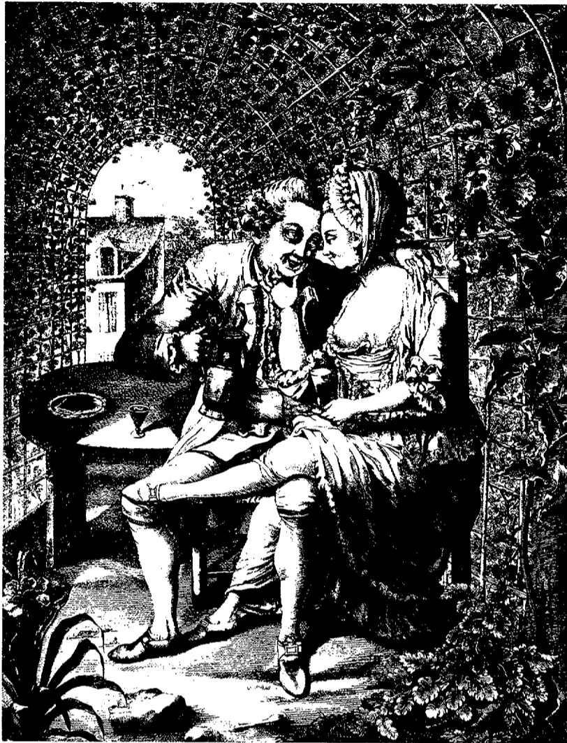
"El amor y el vino", grabado de Droyer

Eduard Fuchs obtuvo con esta obra un éxito inmediato, debido al escándalo provocado y a los procesos