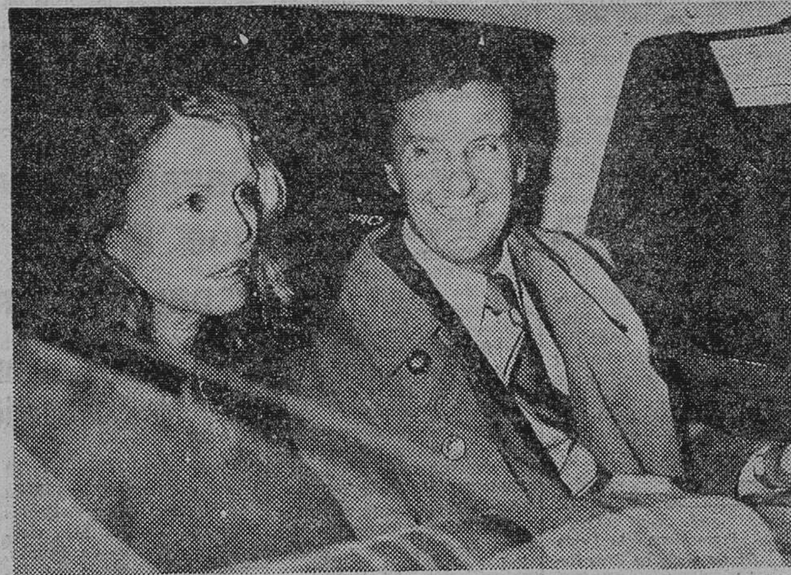
ROBERT STACK CON SU ESPOSA

Robert Stack acaba de firmar un importante contrato para una cadena de la TV americana. El famoso actor será el principal protagonista de «Aquellos inefables puritanos», sátira acerca de los movimientos pro-moral pública de New York en los años veinte.