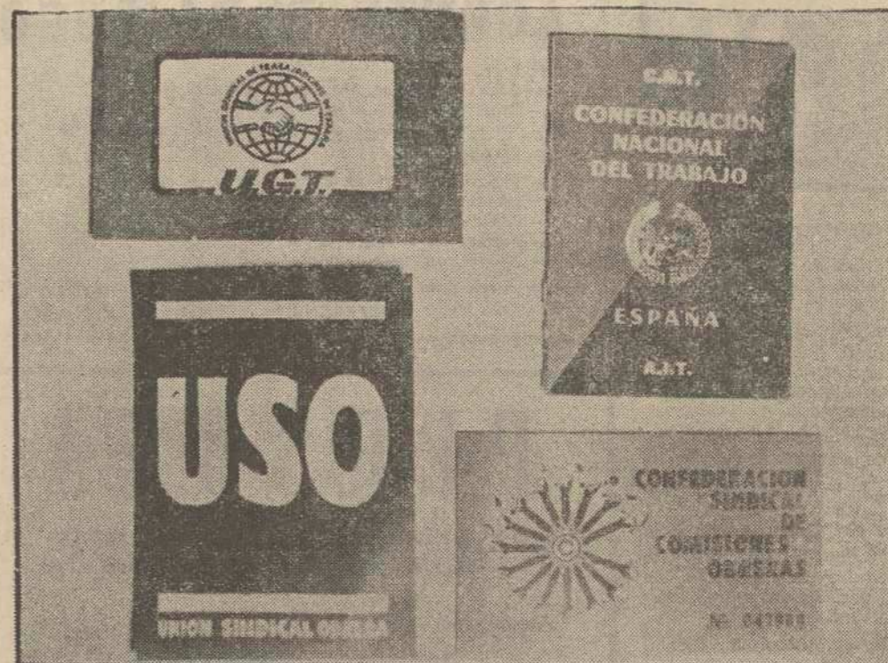
La revista "Opinión" ha hecho pública una información sobre los futuros carnets para los miembros de "Comisiones Obreras", "Unión General de Trabajadores", "Confederación Nacional de Trabajadores" y "Unión Sindical Obrera". A esa información pertenece la fotografía. Los colores utilizados, como en los viejos tiempos, son el rojo y el negro.