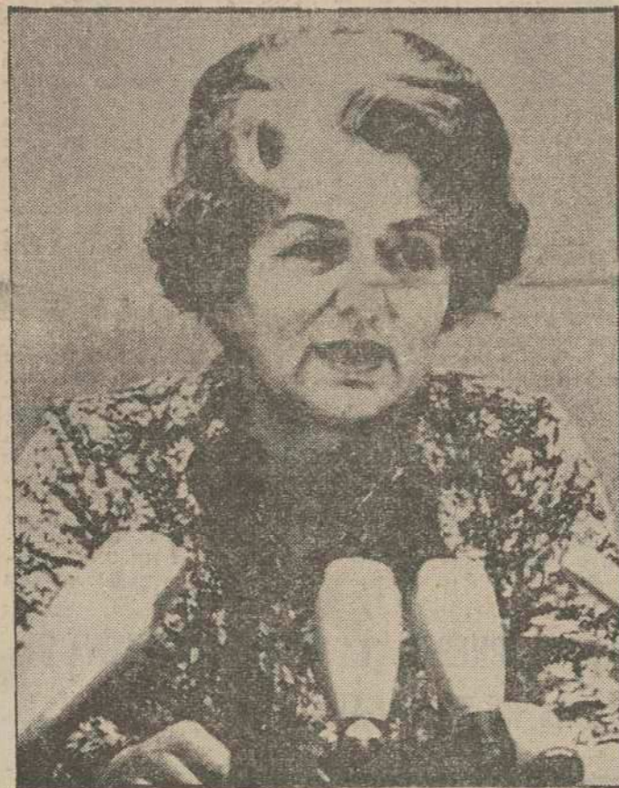
En las pasadas elecciones generales celebradas en la República Federal Alemana, la coalición del canciller Helmut Schmidt en el Parlamento salió incrementada por dos escaños a diez. La noticia oficial la dio a la nación la comisario de las elecciones federales, Hildegard Bartels, quien aparece en esta fotografía en el momento de enfrentarse con las cámaras y los micrófonos.

PEKIN: Manifestaciones multitudinarias contra la llamada «banda de los cuatro»