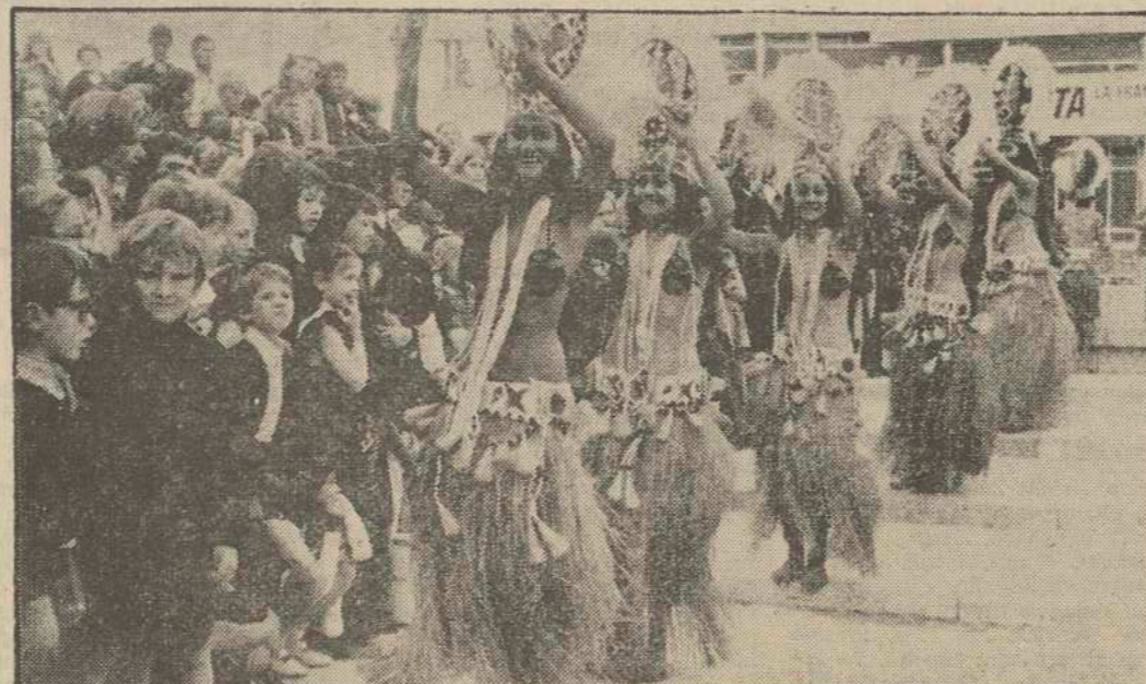
En el Palacio de los Congresos de París se está celebrando una exposición titulada "La Francia de las cuatro esquinas del mundo" que intentará traer otra vez a la memoria de los franceses su reciente pasado colonial. Estas muchachas han llegado de Papeete (Tahiti) y, ante los ojos atónitos de los escolares que hacen su visita de turno a la muestra del perdido mundo colonial ejecutan las danzas típicas de su tierra.