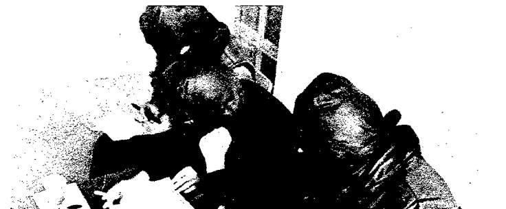
Conferencia enmascarada E. T. A.: otra estrategia

Por esta razón, su «violencia», desde ahora, será «defensiva».