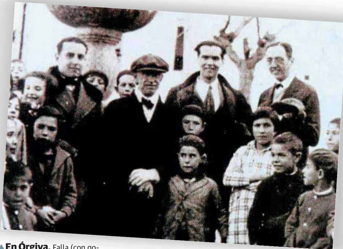
▲ En Órgiva. Falla (con gorra), y Lorca (a su derecha), en la placeta del Horno.