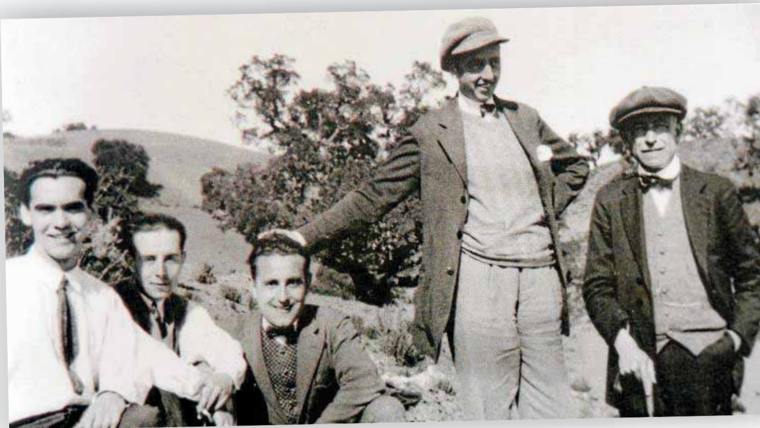
◀ De excursión. Lorca (primero por la izquierda), y Falla (primero por la derecha), en el paisaje alpujarreño.