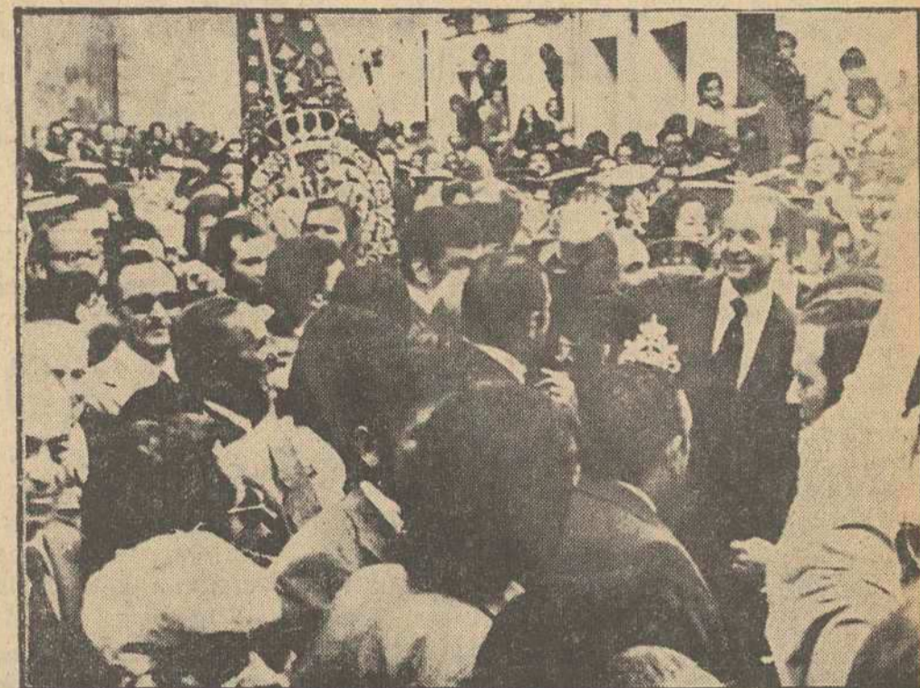
Continúan los Reyes de España recorriendo, en olor de multitud, tierras andaluzas. Esta es una escena constantemente repetida a lo largo del viaje: Don Juan Carlos, sin protocolo apenas, mezclado entre la gente de la calle, saluda a los andaluces que le aclaman.