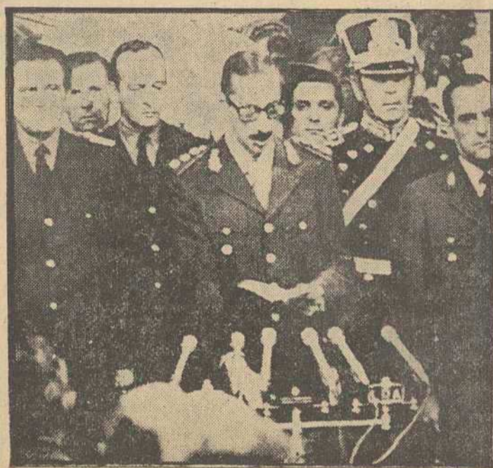
El teniente general Jorge Videla, prestó juramento como presidente de la República Argentina, en una breve ceremonia celebrada en la Casa Rosada. A su izquierda —con cara de pocos amigos— el almirante Emilio Hasser, y a la derecha, el teniente general Orlando Agosti; ambos son componentes de la nueva Junta Militar.

La Comisión Mixta, reunida durante dos horas