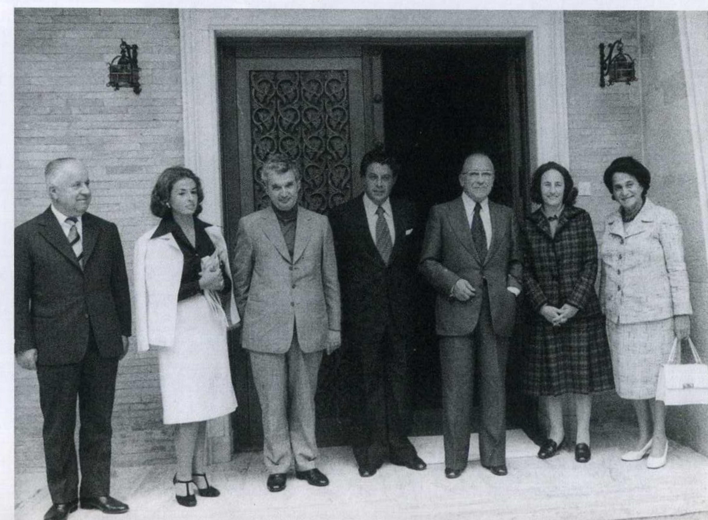
Lagunero entre el Presidente Ceausescu y Santiago Carrillo, Elena la mujer del presidente y dos ministros de su gobierno. Les acompaña Rocío.