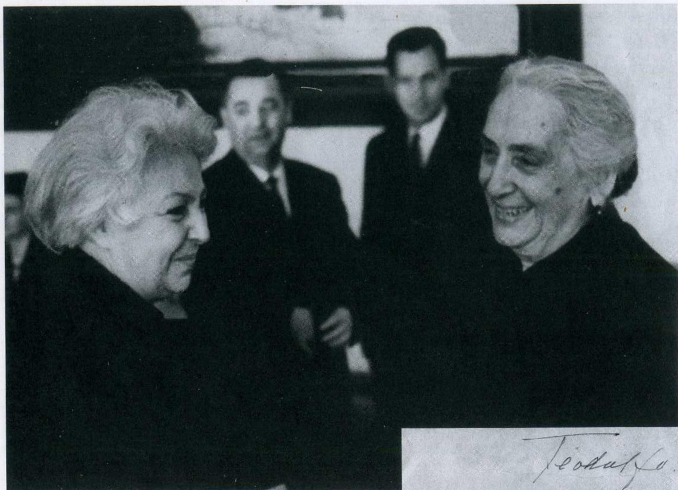
La Pasionaria con María Teresa León.