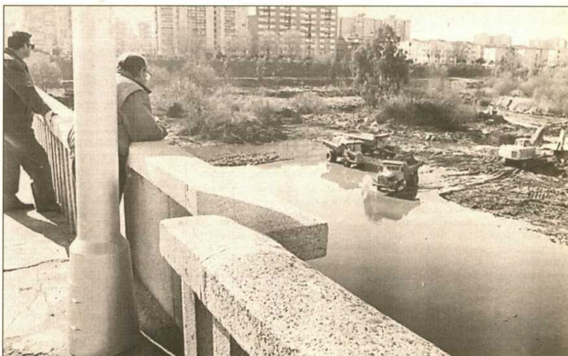
Una vez dragado el cauce y desbrozadas las márgenes, la Confederación comenzará a actuar en las orillas en breve plazo.

Algunas de las isletas que se habían formado por depósitos de arrastre de las aguas han desaparecido asimismo. Se han mantenido sólo aquellas que forman parte de la plataforma del río, que serán aprovechables para el esparcimiento cuando las obras concluyan.