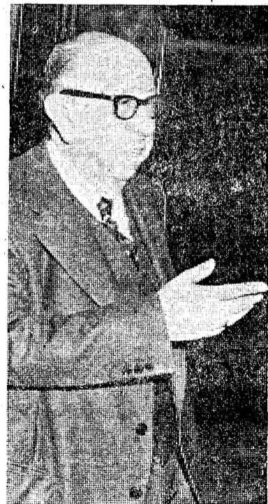
José María Gil Robles

Interviniendo ante el Congreso Electoral de la Unión Cristiana-demócrata Alemana (CDU), Gil Robles subrayó en Hannover la firme decisión de los democristianos españoles en contribuir al establecimiento de la