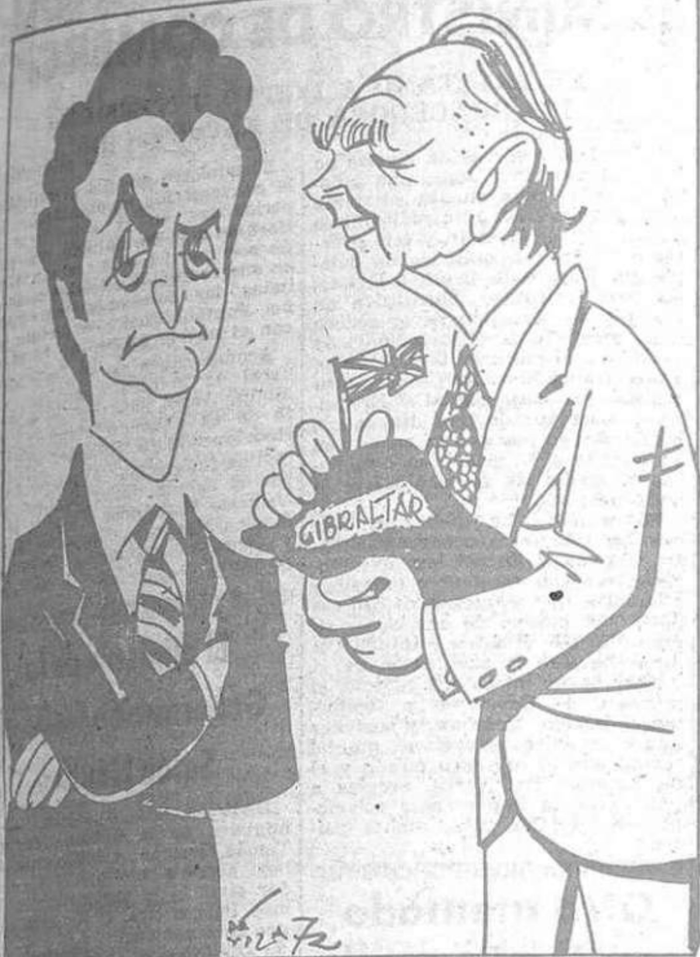
—¡Claro! Por eso no suelta prenda...