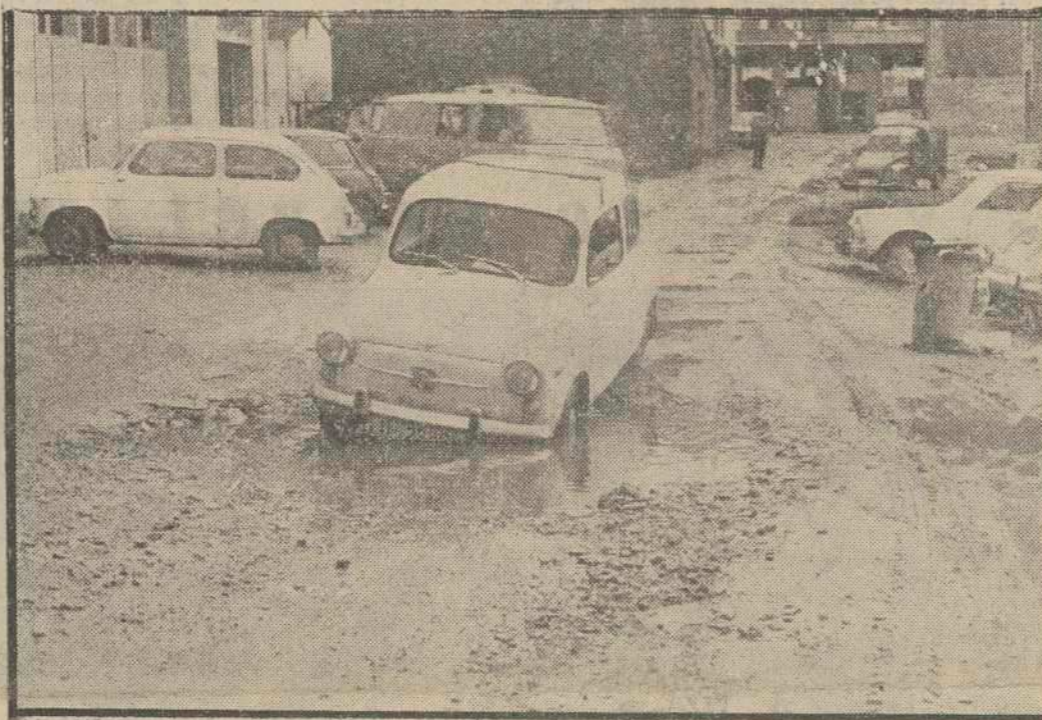
Un lector nos escribía ayer hablandonos del abandono en que el Ayuntamiento tiene a la calle "Islas Cies". Nuestro compañero Vega se trasladó a aquel lugar y obtuvo este grabado. Claramente nuestro comunicante tenía sobrada razón para decir lo que decía. Sobre el problema escribimos en "Lugo capital"