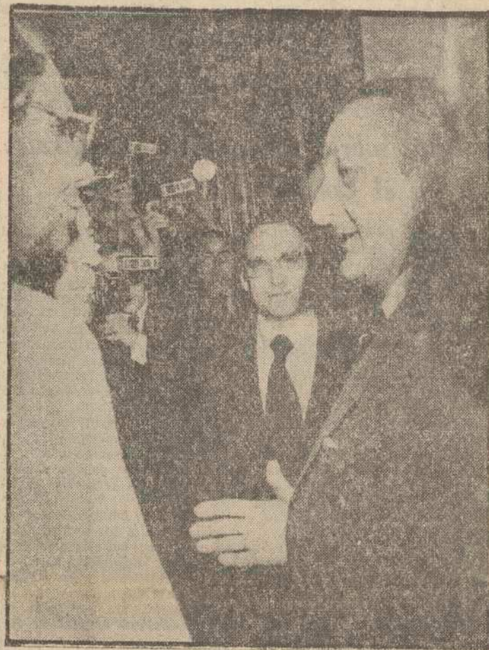
El presidente del Consejo del Reino, don Torcuato Fernández Miranda, fue asaltado por los informadores destacados en el Palacio de las Cortes, tras cada una de las reuniones del alto organismo. Condescendiente hasta el máximo, el señor Fernández Miranda trató de calmar las ansias adelantando una sola noticia: Que había terna.

A LOS CUARENTA Y CUATRO AÑOS, ES EL PRESIDENTE DEL GOBIERNO MAS JOVEN QUE TUVO ESPAÑA