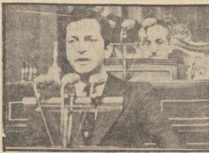
Don Adolfo Suárez González, durante su brillante intervención en las Cortes el pasado día 9 de junio, solicitando la aprobación de la Ley del Derecho de Asociación Política. El hoy presidente del Gobierno actuó en dicha ocasión como ministro secretario general del Movimiento

Serán su pudo saber, el nuevo presidente recibió a media tarde una llamada del Palacio de la Zarzuela, y salió de su domicilio hacia la residencia real para reunirse con el Rey.