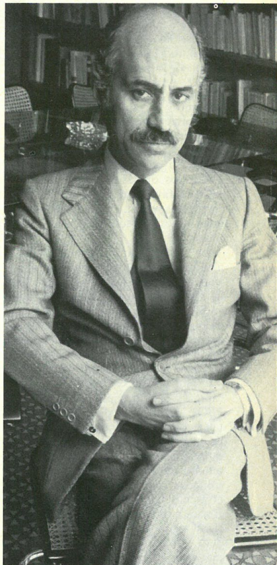
Trevijano, el gran ausente por obra de Fraga.

Tras la votación, un socialdemócrata criticó abiertamente la posición de quienes votaron a favor, debilitando así la situación del PSOE, con estas palabras: "El Partido Comu-