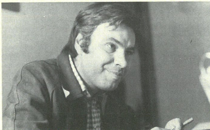
Felipe González (PSOE) y Enrique Barón (FPS): socialistas de la discordia.