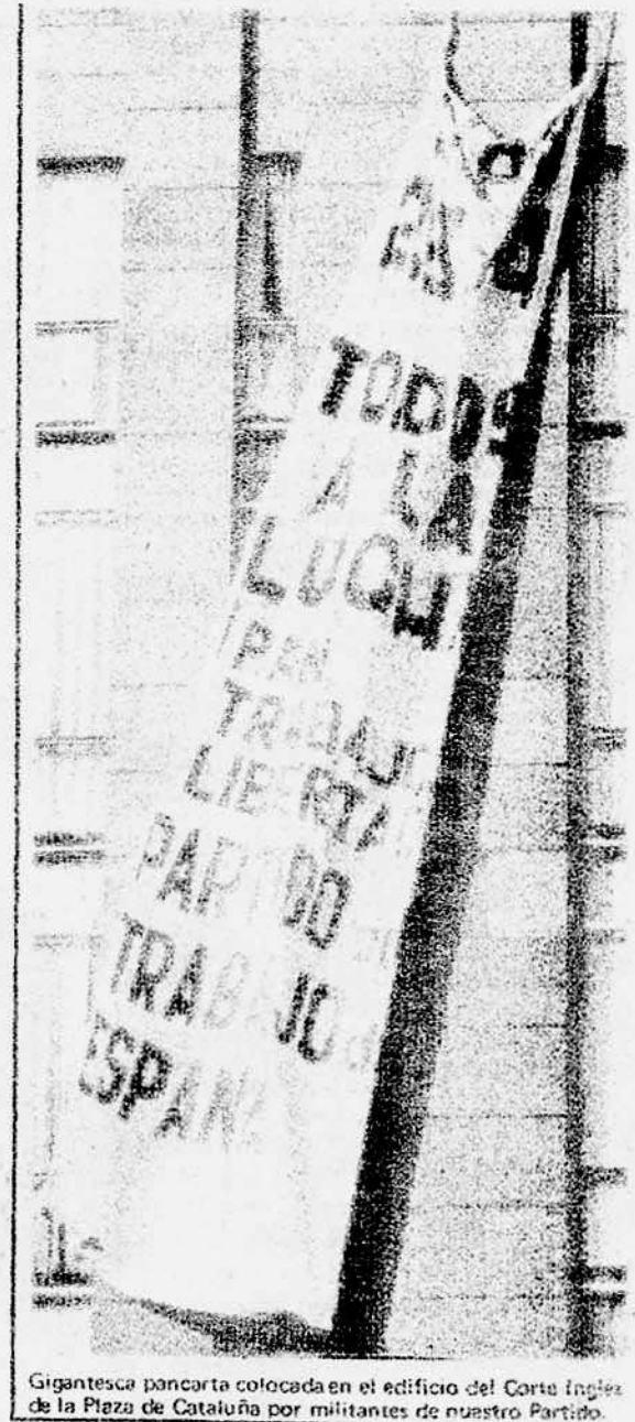
Gigantesca pancarta colocada en el edificio del Corte Inglés de la Plaza de Cataluña por militantes de nuestro Partido.

El proletariado y el pueblo se levantan con su Junta Democrática El 90 % de la construcción en huelga