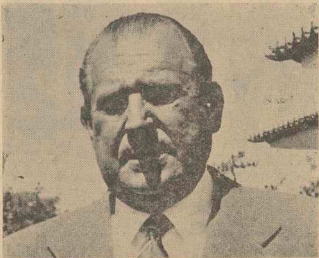
DON JUAN DE BORBON, CONDE DE BARCELONA