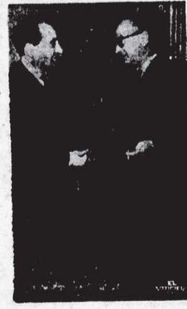
En la fotografía, Mr. Mendes-France, se despide de Mr. Guy Mollet, después de la entrevista en el Ministerio del Interior. Guy Mollet fue encargado de formar el nuevo Gobierno.