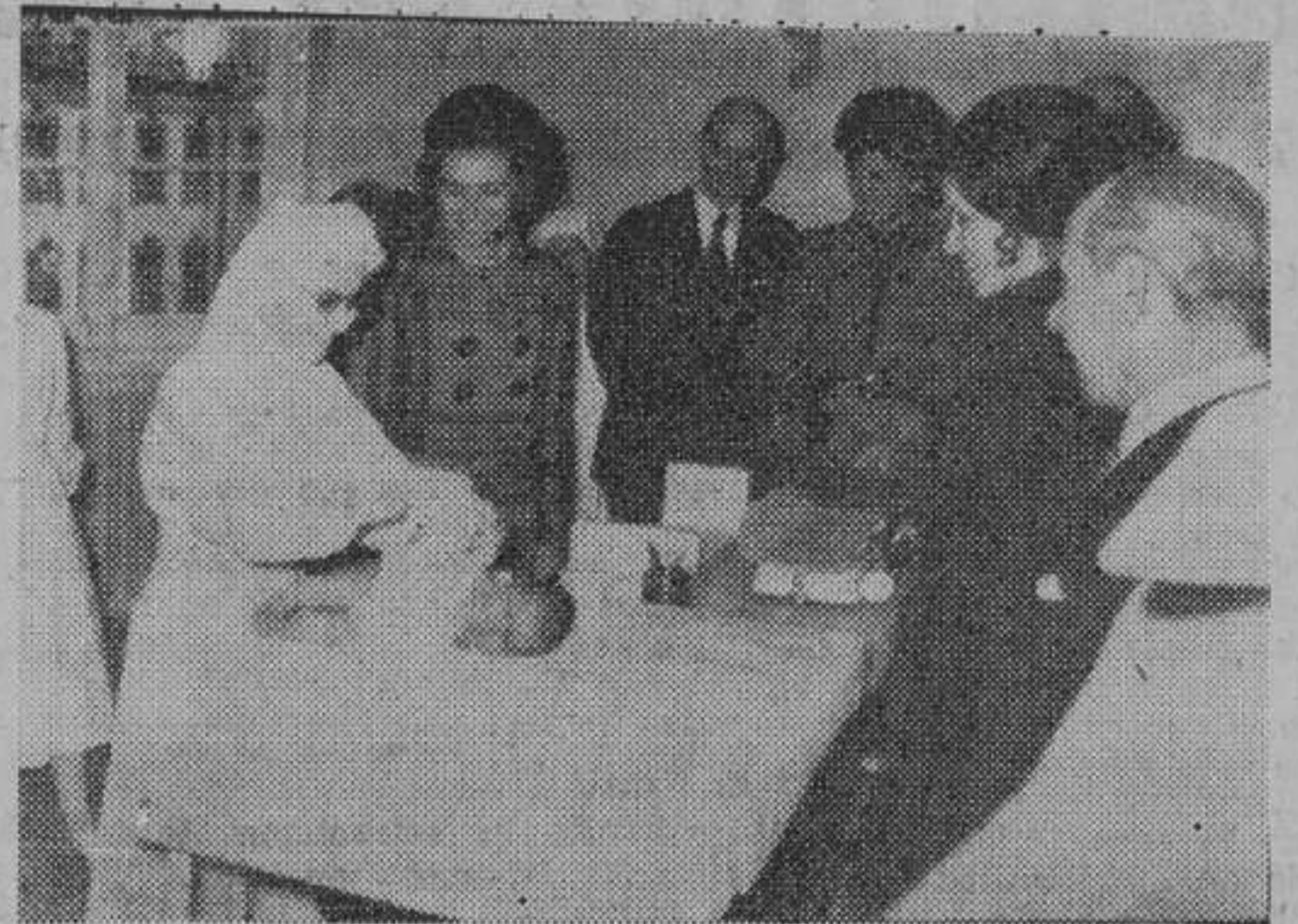
Después de firmar en el libro de oro de la institución, la princesa de España visitó una sala en la que se exhibían los planos y organigramas de proyectos de reorganización del centro.

Después de saludar al cuerpo facultativo, doña Sofía recorrió detenidamente los quirófanos, salas de recuperación y de ginecología, la residencia de alumnas matronas, un nido de recién nacidos, una sala de obstetricia, salas de partos, servicios de prematuros, la biblioteca, laboratorio y capilla.