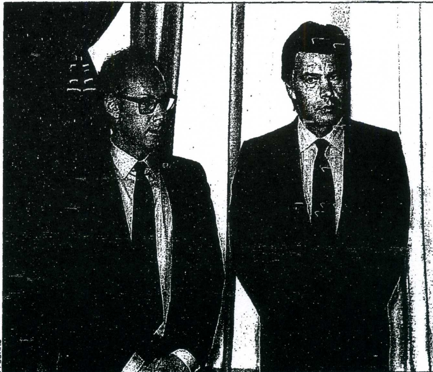
Muy pronto, Miguel Boyer volverá a asesorar al presidente en materia económica.