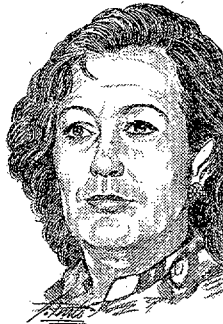
Mariscal de Gante

El segundo motivo de impugnación se basa en que la Sala de lo Contencioso-Administrativo habría incurrido en un «defecto en el trámite procesal» que invalidaría sus actuaciones. En su opinión, dado que el abogado del Estado se opuso a suspender el traslado de la fiscal, el Tribunal debió pedir un informe al Ministerio de Justicia, lo que no hizo.