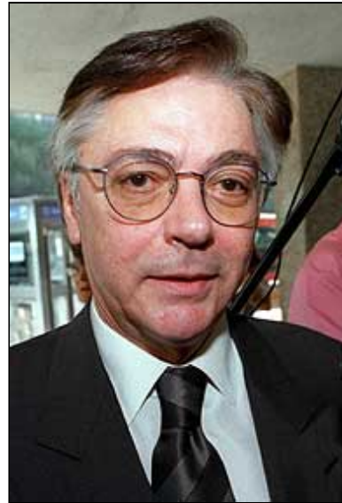
Francisco Paesa, en 1995.

Paesa siempre tuvo buenas relaciones con el poder y con la llegada de los socialistas a La Moncloa el espía estrechó lazos con el Ministerio del Interior y colaboró con Julián Sancristóbal, director de la Seguridad del Estado. En 1986 el 'súper agente Paco', que ya estaba introducido en el mundillo del tráfico de armas, vendió como señuelo a ETA unos lanzamisiles dotados de sensores, que sirvieron para desmantelar la cooperativa Sokoa, donde los terroristas guardaban los archivos del impuesto revolucionario.