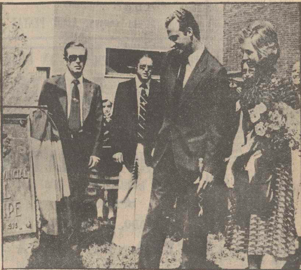
Los Reyes de España, Don Juan Carlos y Doña Sofía, inauguraron en Pontevedra la ciudad infantil "Príncipe Felipe", que lleva el nombre de su hijo, el príncipe heredero.