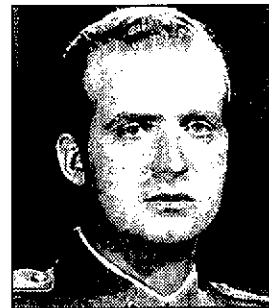
LA ADVERTENCIA DEL PRINCIPE

Una vez lanzada la declaración de Juan de Borbón, pensaban, la Junta Democrática iniciaría en Lisboa una campaña "no monár-