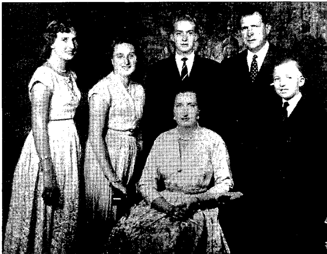
Don Juan, en una foto familiar, poco antes de que don Juan Carlos marchase a España para recibir educación bajo la tutela del General Franco.

Se trataba de una alianza de fuerzas y personalidades políticas que se proponía actuar para provocar la caída del régimen. Y pretendían coronar la operación invitando a Don Juan de Borbón y Battenberg a que se pusiera a la cabeza de la oposición y lanzara un manifiesto tomando posición en contra de Francisco Franco, como lo había hecho en 1945.