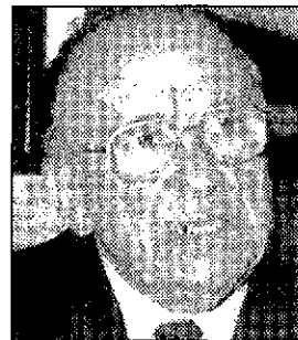
LAS ESPERANZAS DE CARRILLO

tas habían acordado plantear abiertamente el Conde de Barcelona la necesidad de que hiciera una declaración a favor de la monarquía democrática. Ninguno creía que la de su hijo Juan Carlos, prevista por Franco, pudiese serlo nunca, como señalara poco más tarde Santiago Carrillo.