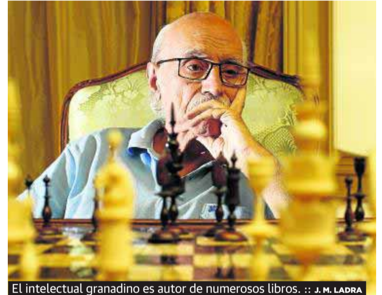
El intelectual granadino es autor de numerosos libros. :: J. M. LADRA

Suspendió la comida y me llevó en el coche oficial hasta su despacho, en la Puerta del Sol. Me preguntó que podía hacer él y le advertí que