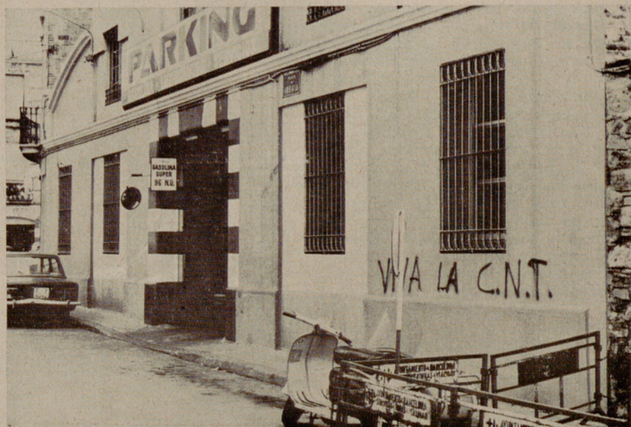
EN SANS (Barcelona)