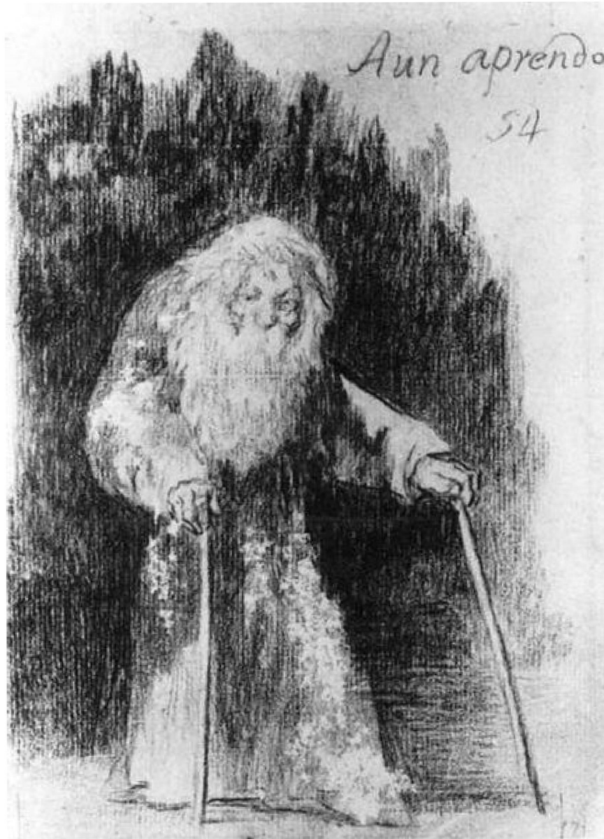
("Aun aprendo", Francisco de Goya y Lucientes 1746-1828)