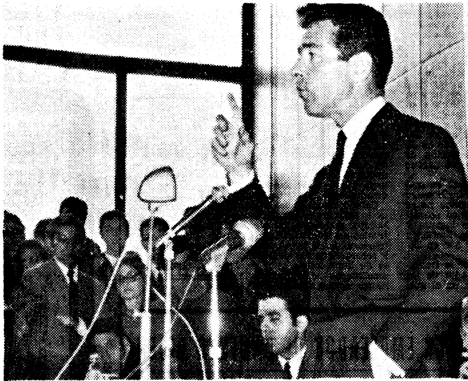
Servan-Schreiber durante su conferencia en la Facultad de Derecho de Barcelona

También se convocan cien becas para especialización universitaria y técnica destinadas a graduados, hijos de trabajadores españoles emigrados en América, que deseen completar sus conocimientos en España.—Europa Press.