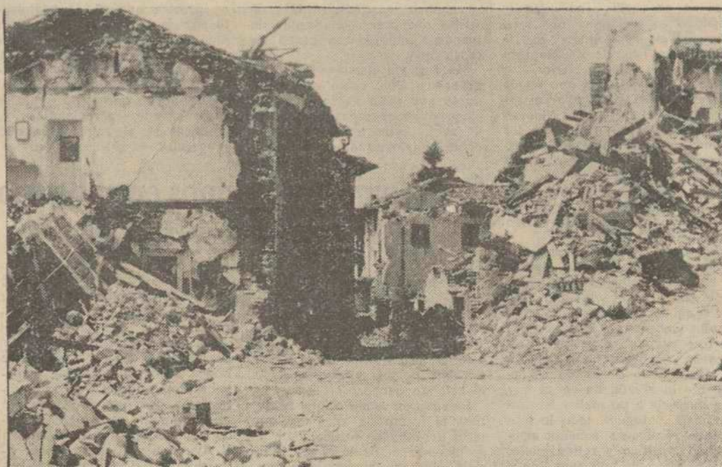
La región italiana de Friuli ha quedado totalmente devastada tras los últimos terremotos. Los edificios que habían sido reconstruidos tras el seísmo del pasado mes de mayo, volvieron a convertirse en ruinas. Los habitantes de la comarca viven en tiendas de campaña mientras preparan su definitivo éxodo. Dentro de poco, Friuli será un desierto.