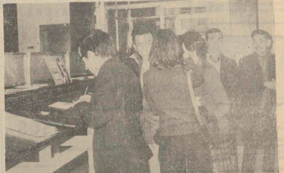
Pese al paro registrado ayer en la Administración de Correos de Lugo, que afectó sobre todo a cartería, el público, escaso, acudió a la Casa de la Calle de San Pedro. Aquí vemos a algunas personas en el vestíbulo, cubriendo impresos de certificados y giros. Se echaba de menos el febril movimiento tradicional en el edificio a la hora en que fue tomada la fotografía.