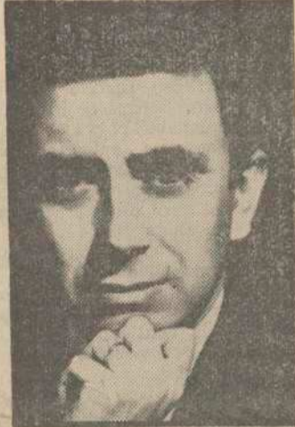
LUIS MARIA ANSON