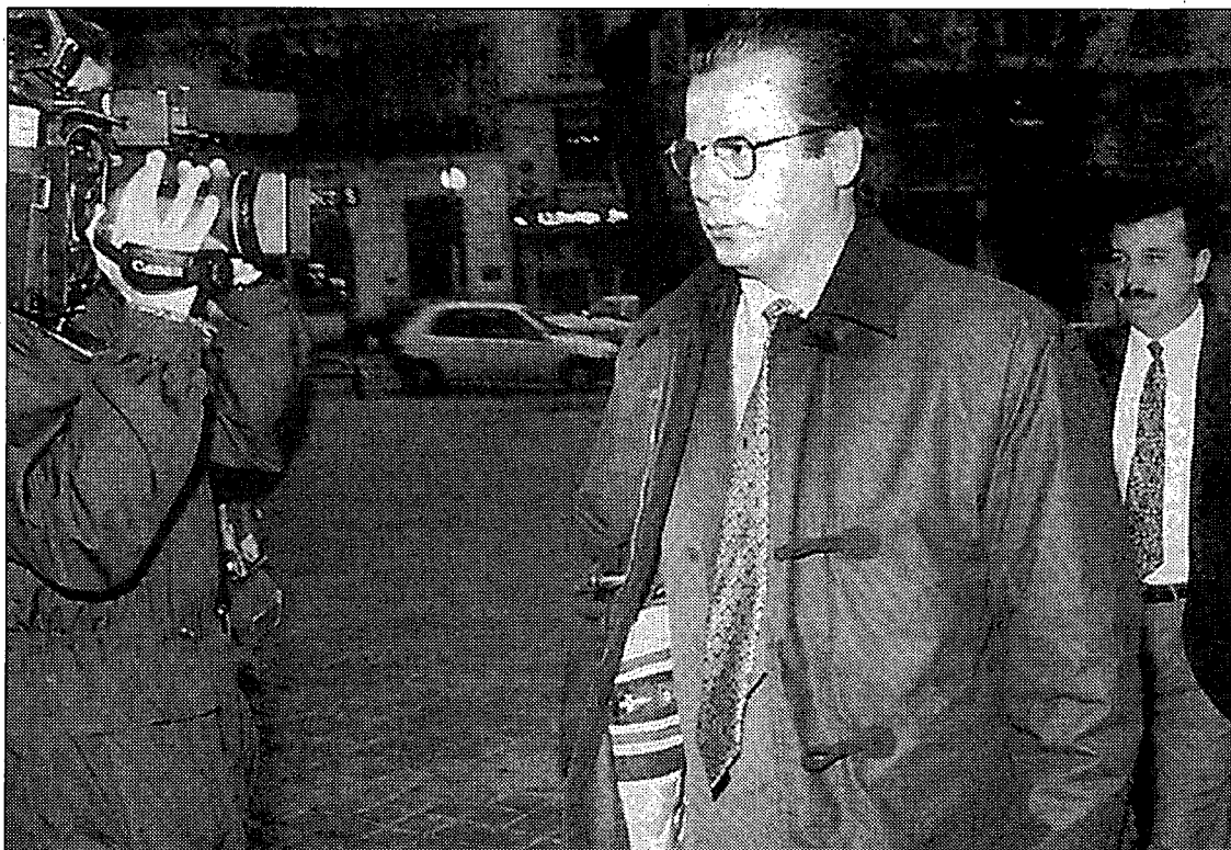
El jutge de l'Audiencia Nacional, Baltasar Garzón.