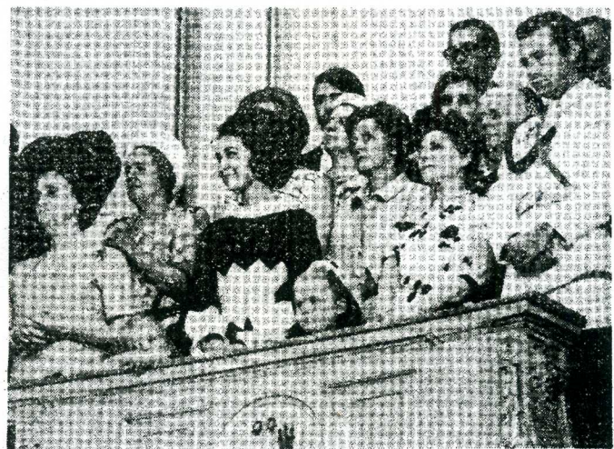
El día 23 de julio, la princesa Sofía y sus hijos presentaron el acto desde una de las tribunas del público.