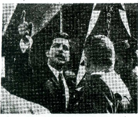
Adolfo Suárez, que en julio de 1969 era gobernador civil de Segovia.