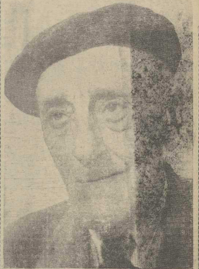
Mañana, lunes se celebrará en Cambados el "Día das Letras Galegas", dedicada este año, al poeta Ramón Cabanillas en su centenario.

El ministro de Obras Públicas dijo que el desastre del "Urquiola" es "un accidente desgraciado y lamentable. No sabemos hasta qué