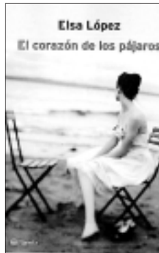
EL CORAZÓN DE LOS PÁJAROS. Elsa López. Editorial Planeta. 265 páginas. 2.800 pesetas.