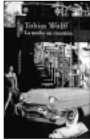
LA NOCHE EN CUESTIÓN Tobias Wolff. Editorial: Alfaguara. 297 páginas.

H ay escritores que te afeitan en seco. Su prosa es como una navaja. No escriben párrafos, escriben cortes, tajos en el alma, la verdad desnuda. El gurú yanqui de este tipo de escritura es Raymond Carver, el maestro del denominado realismo sucio. El autor que nos ocupa, Tobias Wolff, hace otro tanto de lo mismo. Alfaguara ha publicado La noche en cuestión , quince relatos que te dejan con el estómago revuelto, con un extraño sabor de boca. Wolff habla de sucesos cotidianos y les mete una vuelta de tuerca que pone al mundo nuestro de cada día patas arriba. Un periodista al que despiden por inventarse una necrológica o un hombre que espera en la cola de un banco y cae muerto de un disparo son sus temas. Los relatos de Wolff son puñetazos de realidad. Tobias hace honor a su nombre de profeta y nos explica que el mundo más redondo puede saltar en pedazos en cuestión de segundos. Decía Raymond Carver en un poema que siempre había motivo para escribir. Por ejemplo, citaba, una mujer que fuma un cigarrillo en una ventana, mientras fuera llueve. Sólo eso. Estos autores creen que la realidad siempre le gana a la ficción, el sprint de la realidad es más cruel. Parecen textos