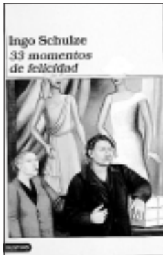
33 MOMENTOS DE FELICIDAD. Ingo Schulze. Editorial Destino. 2.800 pesetas. 236 páginas.